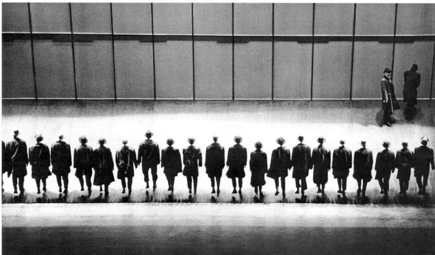
JDE choreographed by Jean-Pierre Perreault

fresh, contemporary readings. Dance's full potential in this regard is untapped, rich with possibilities.